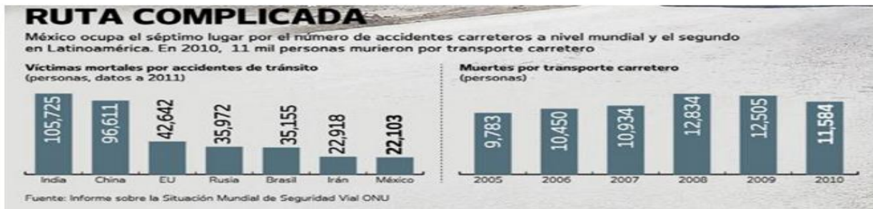
Fuente: El Universal: "Transportes de carga, peligro en la carretera"; 26 de abril 2012.

Conocemos la importancia que tiene el autotransporte de carga para nuestro país, ya que mediante los camiones de carga se mueven insumos, materias primas y productos terminados para satisfacer la creciente demanda de las industrias y los clientes a lo largo y ancho de nuestro país, puesto que el transporte terrestre se erige como el medio más utilizado para transportar mercancías, por encima del ferroviario y marítimo.